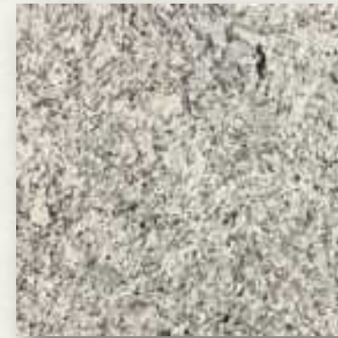
MESETA DE GRANITO

PENSADA PARA ADAPTARSE A LAS NECESIDADES DE TU FAMILIA