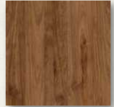
CARPINTERÍA EN COCINA

| Blanco Dallas (Puede variar tonalidad)