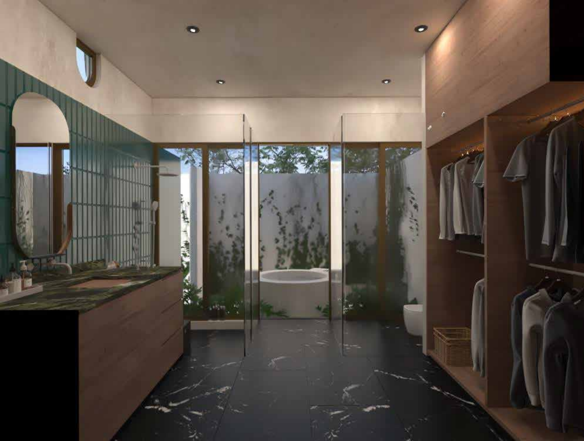
BAÑO CUARTO PRINCIPAL