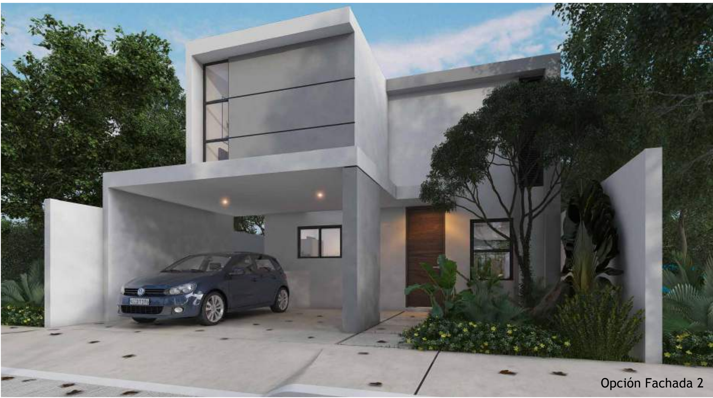
Opción Fachada 2