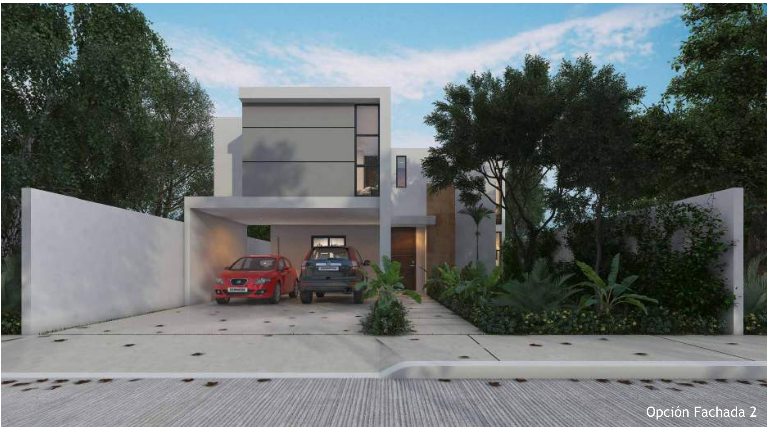
Opción Fachada 2