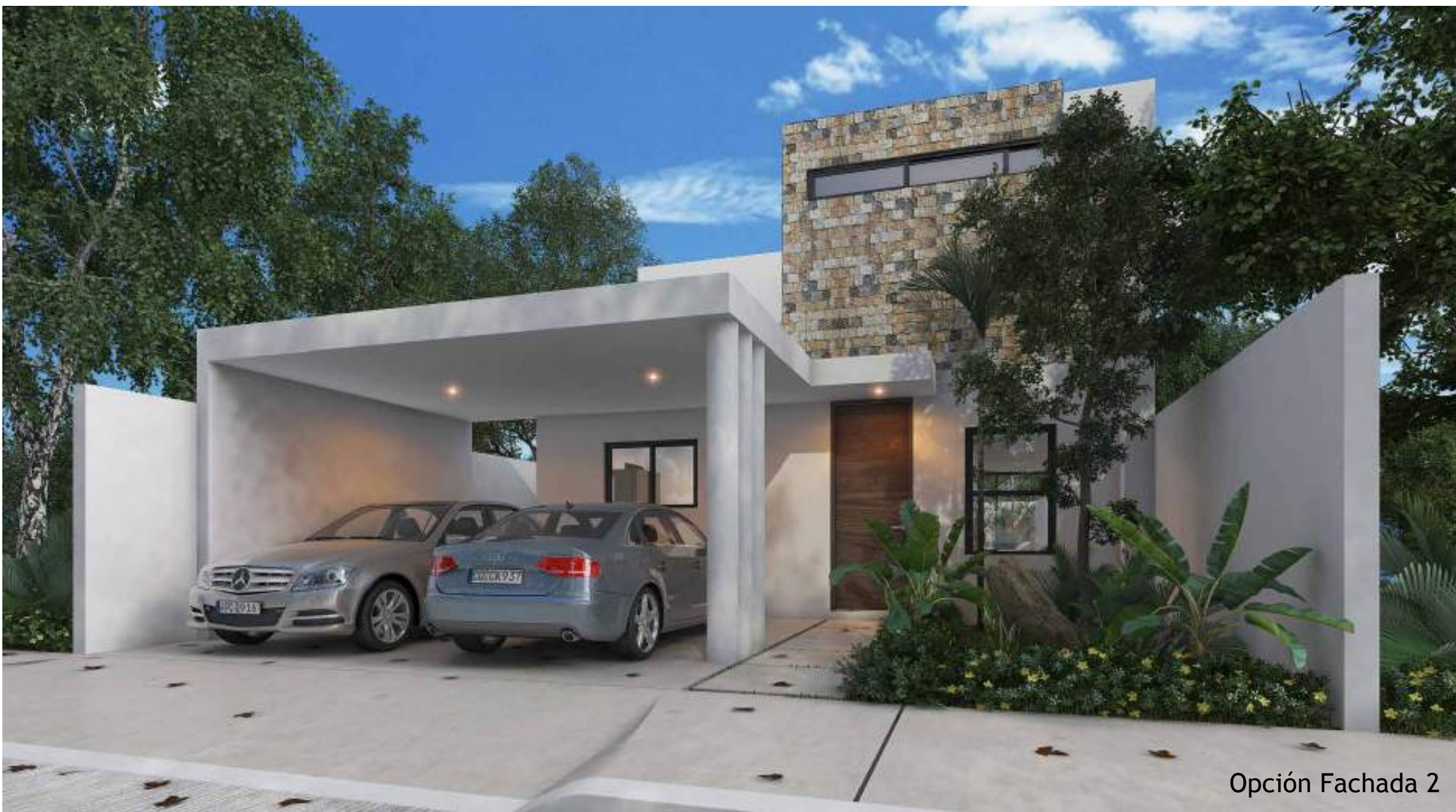
Opción Fachada 2