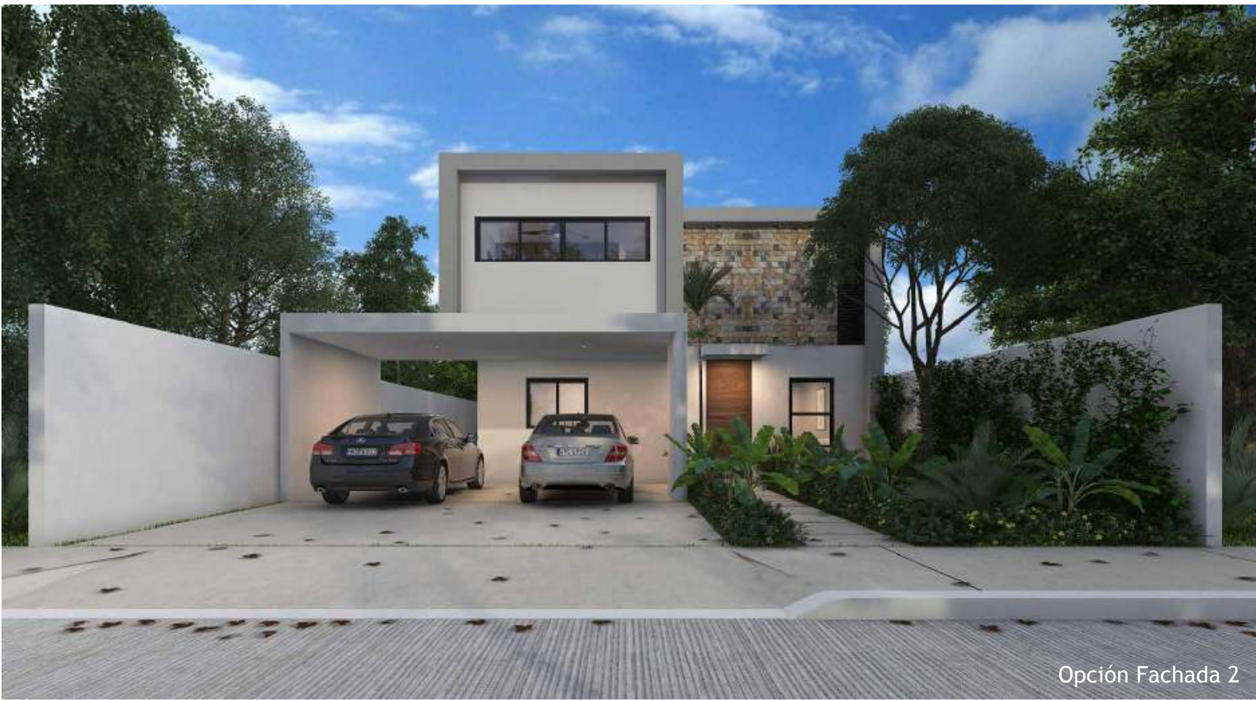
Opción Fachada 2