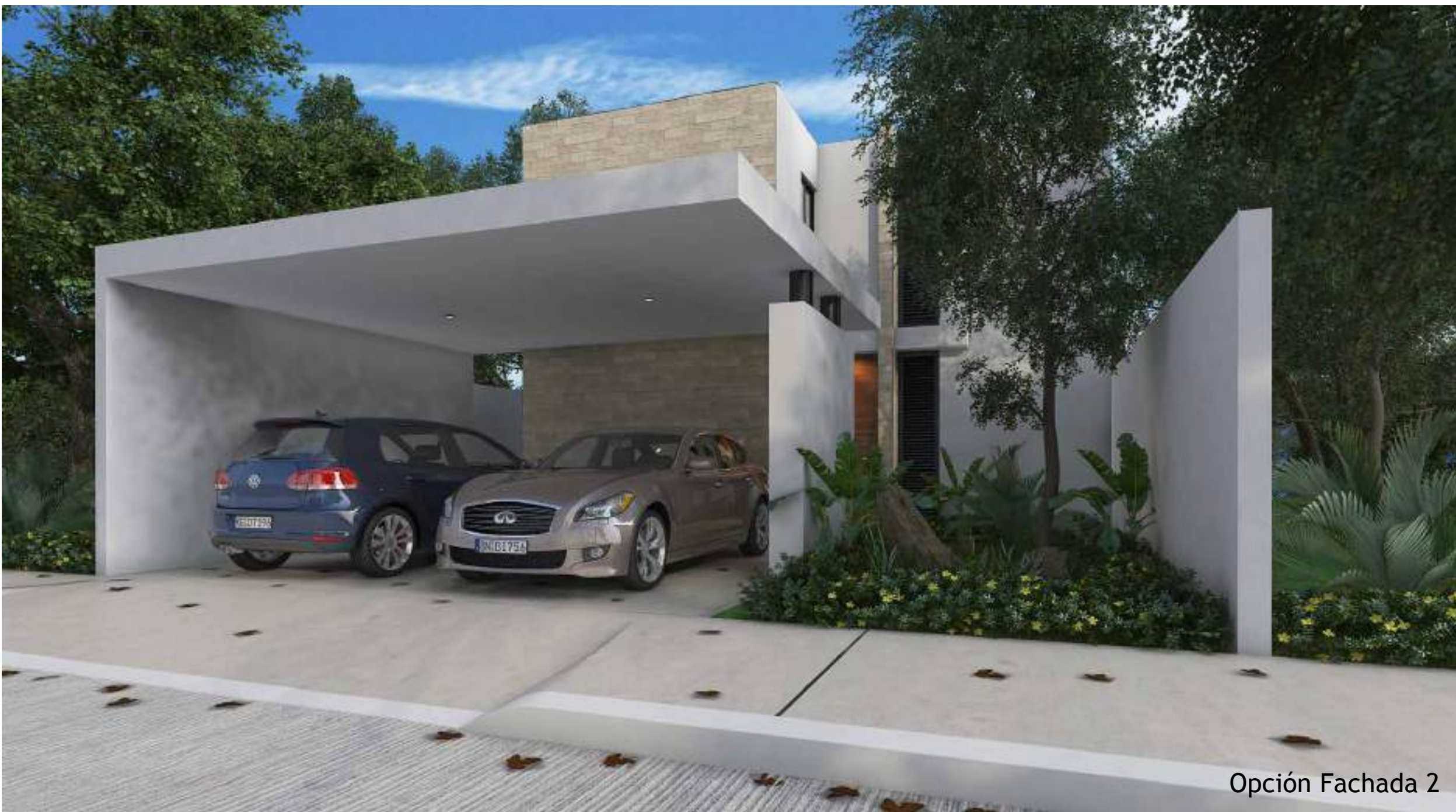
Opción Fachada 2