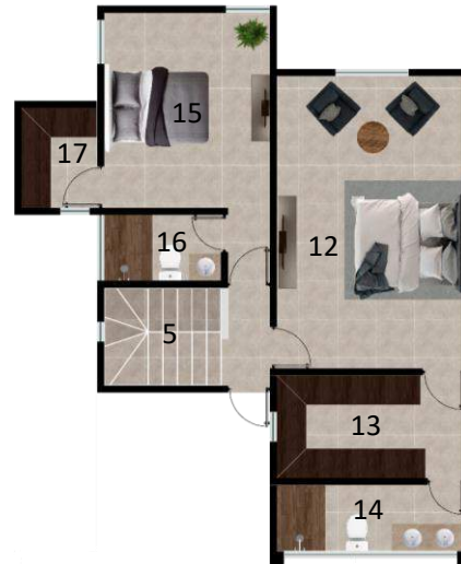
PLANTA ARQUITECTONICA PLANTA ALTA