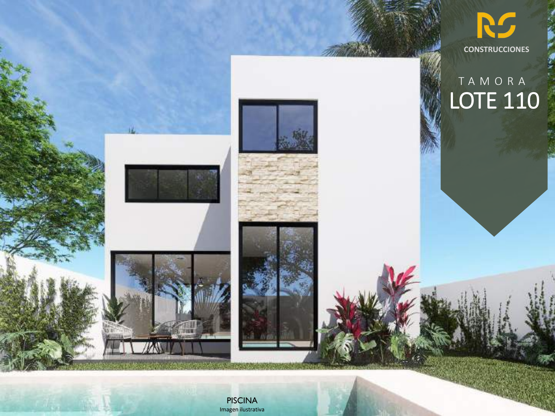
PISCINA Imagen ilustrativa