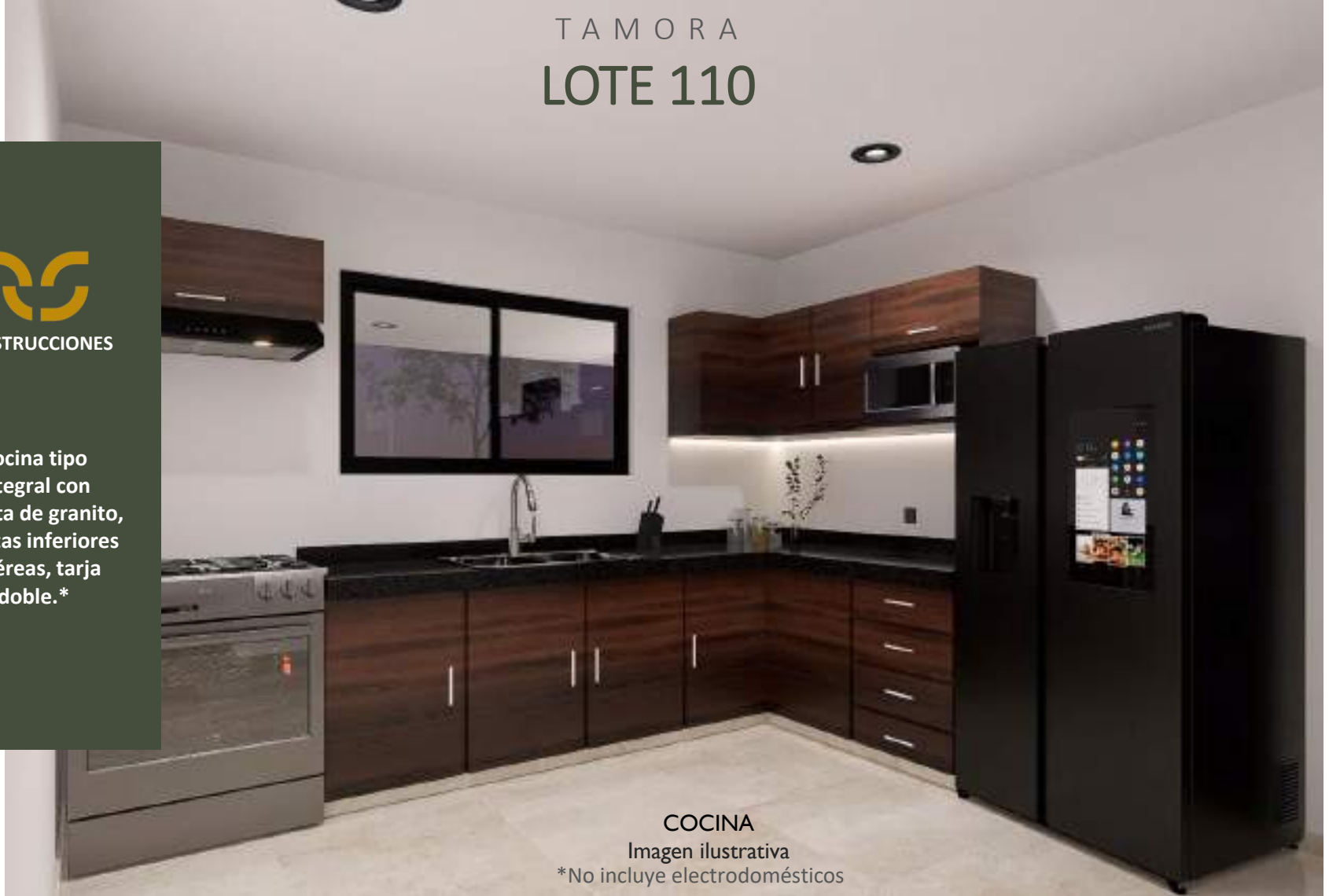
COCINA Imagen ilustrativa *No incluye electrodomésticos

Cocina tipo integral con meseta de granito, gavetas inferiores y aéreas, tarja doble.*