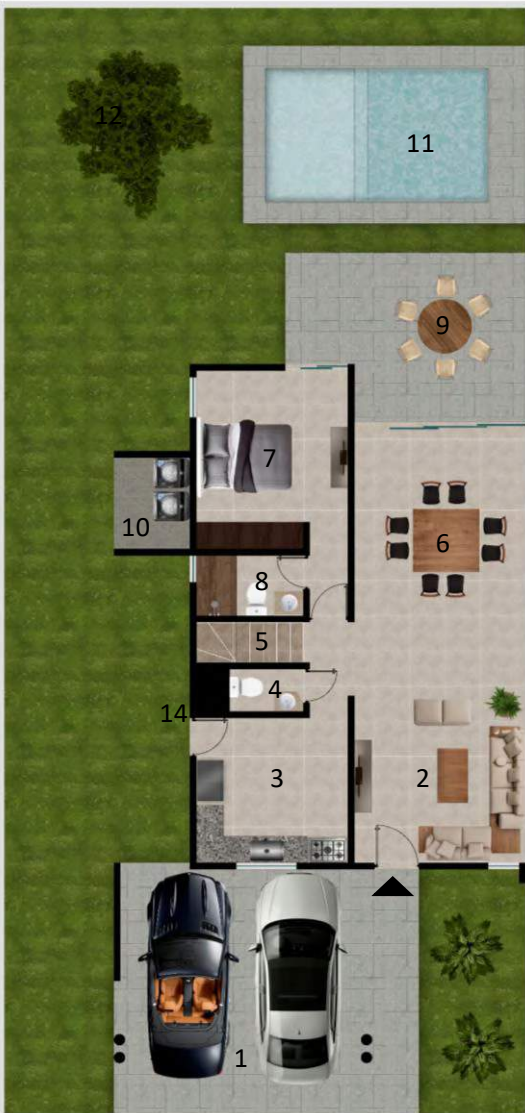
PLANTA ARQUITECTONICA PLANTA BAJA