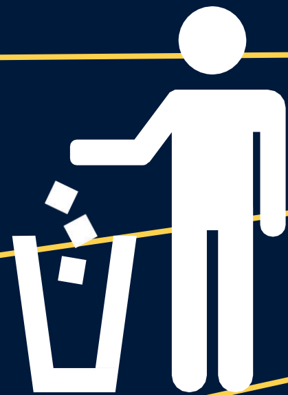
Área de Basura